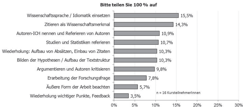
Tab. 3: Umfrage bei Kursabschluss

Bedeutung beigemessen. Dies zeigt zweierlei: erstens, dass gewisse Grundthemen zu akademischem Schreiben zentral sind, und zweitens, dass von diesen Themen alle Studierenden profitieren, unabhängig von dem vorausgehenden Wissensstand.