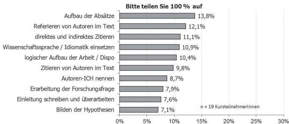
Tab. 2: Umfrage bei Kursmitte

Bei Abschluss des Kurses wurde nochmals erfragt, wovon die Studierenden am meisten profitiert hätten. An erster Stelle wurde hier das Erlernen der Wissenschaftssprache genannt, welches mit dem Beginn korrespondiert. Auch in der Schlussumfrage wurde – gemäß der Zwischenumfrage – der Umgang mit dem korrekten Zitieren, das Referieren von Autoren und Statistiken, die Nennung des eigenen Autoren-Ich – somit die gesamte Problematik um die eigene Verortung in Bezug auf die Forschungsliteratur – auf den Positionen zwei bis vier genannt. Die inhaltlichen Aspekte wie die Hypothesenbildung, die Erarbeitung der Forschungsfrage liegen im unteren Bereich, wie auch in der Zwischenumfrage.